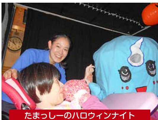
たまっしーのハロウィンナイト

見る・聞く・感じる…に全力を注いだ【体感ハウス】の2企画が賑わっていました。どちらもお客さんが途切れることなく、訪れています。