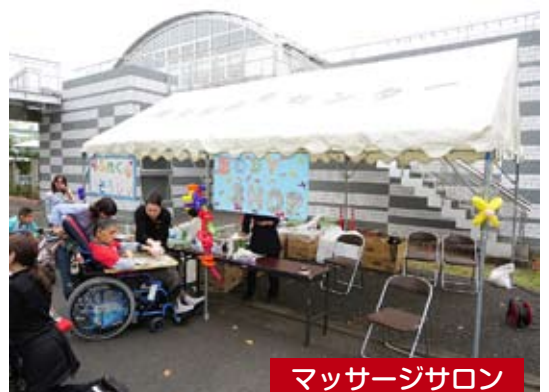
マッサージサロン

お腹を満たした後は、からだや心の癒しがほしくなりますね。おや、ちょうどいい所に【マッサージサロン】がありました。手のマッサージと足のリフレクソロジーで、気持ちよくなっちゃっていますか? 手の温もりに勝るものは、ありませんよね。