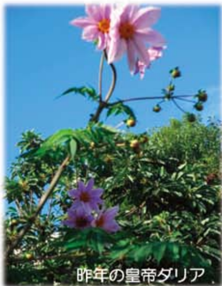
昨年の皇帝ダリア

花や自然が大好きです。花についてもっと知りたいと思い、花の認定試験を受験したこともあります。当センターに着任し、四季折々の草花の豊かにわくわくしました。4 月の桜。桜が丘の名の通り、まさに桜の園になります。桜吹雪の下で、利用者さんと職員が微笑んで見上げていたシーンは忘れられません。玄関通りの花みずきも素敵です。白、ピンクの花が咲き、秋には赤い実を付けます。そして皇帝ダリア。今年は例年にも増して台風が多く、2 メートル以上に成長していた枝が折れました。添え木をしてあげたいと思いながら通勤していましたが、ある日優しい方によって添え木をしていただきました。皇帝ダリアが天高く咲く日も、もうすぐです。今年も大輪の花を咲かせること