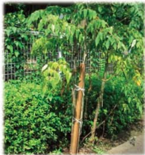
添え木で無事復活