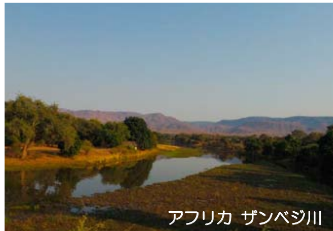
アフリカ ザンベジ川